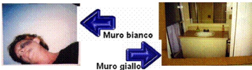
Foto che la presunta vittima dichiara di aver scattato a se stessa nel bagno di casa: E' FALSO

La polizia e la procura di Ventura, CA, colpevoli di avere istigato la presunta vittima a produrre evidenze contraffatte, si rifiutano di investigare!